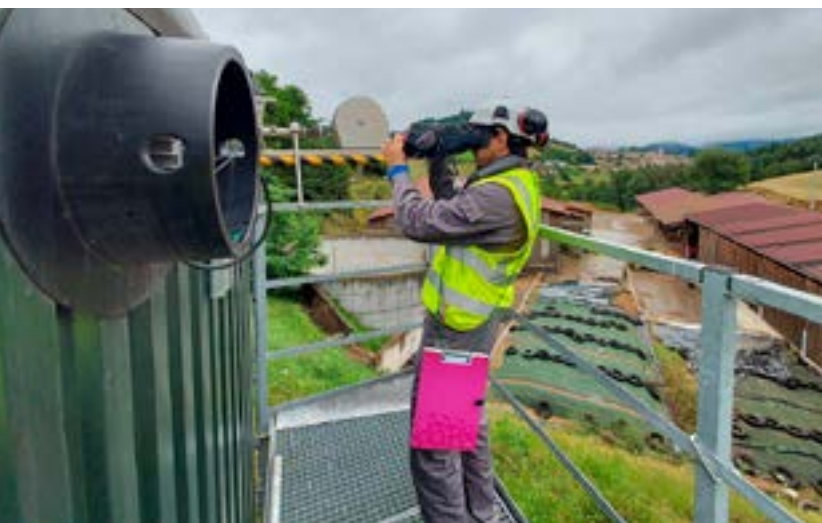
Détection d'émissions fugitives sur un digesteur lors de la campagne régionale