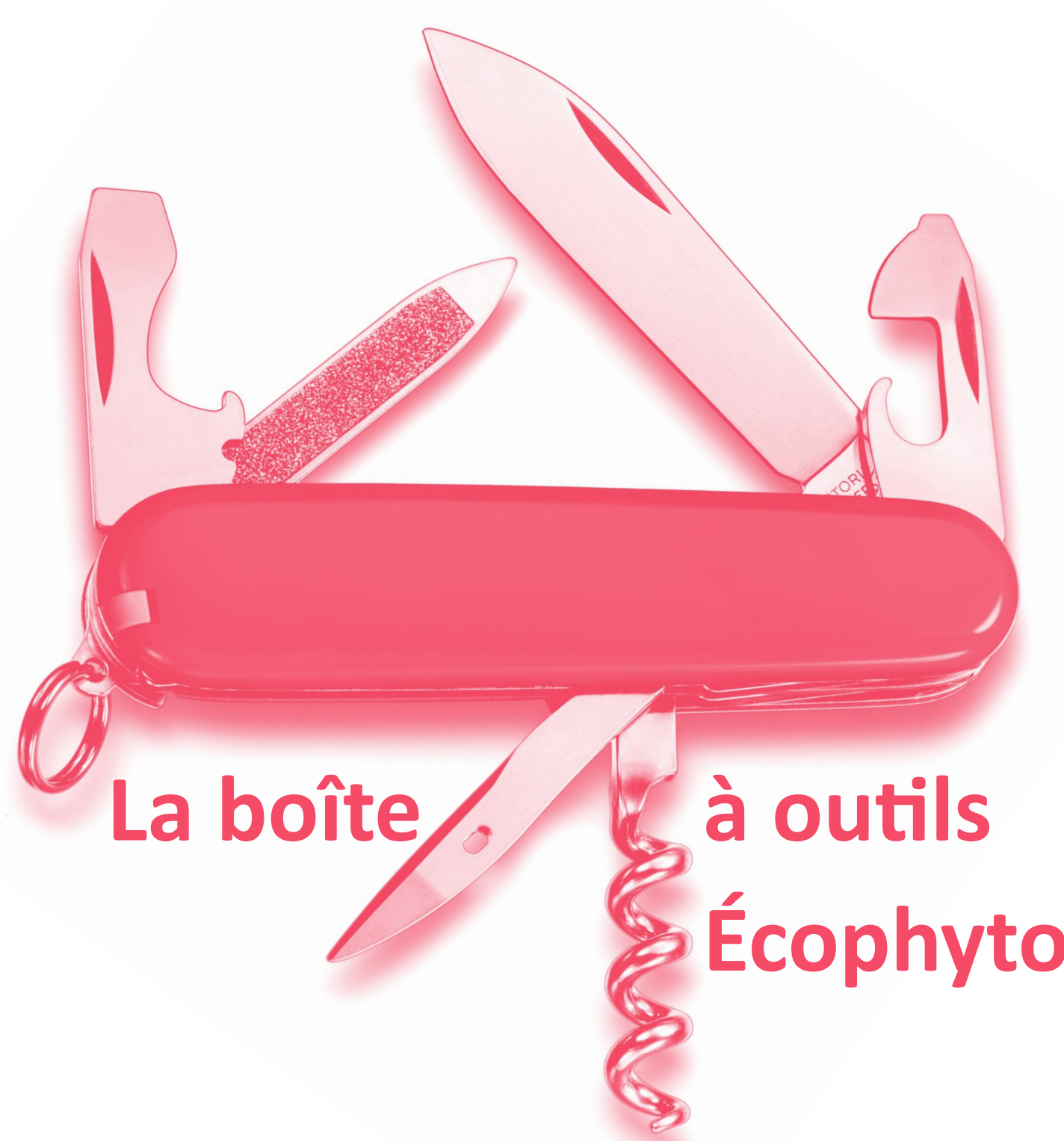
La boîte à outils Écophyto

Jardins, Espaces Végétalisés et Infrastructures linéaires longues raisonnent l'utilisation de phytos